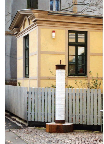
Schillerweg 31 · Schaaarei-Zedek-Synagoge