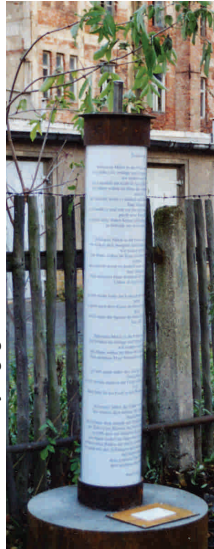
Färberstraße 6 · Ahawas-Thora-Synagoge